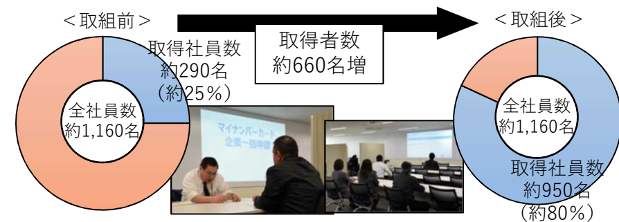
C社のマイナンバーカード取得状況